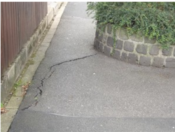
Verengung 2 Wie aus dem Foto ersichtlich ist die Breite der Durchfahrt für einen Rollstuhlfahrer gerade ausreichend. Problematisch war es an der Bodenwelle mit Riss.